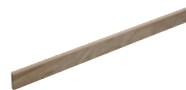
Battiscopa Nature Argan 19 8x120