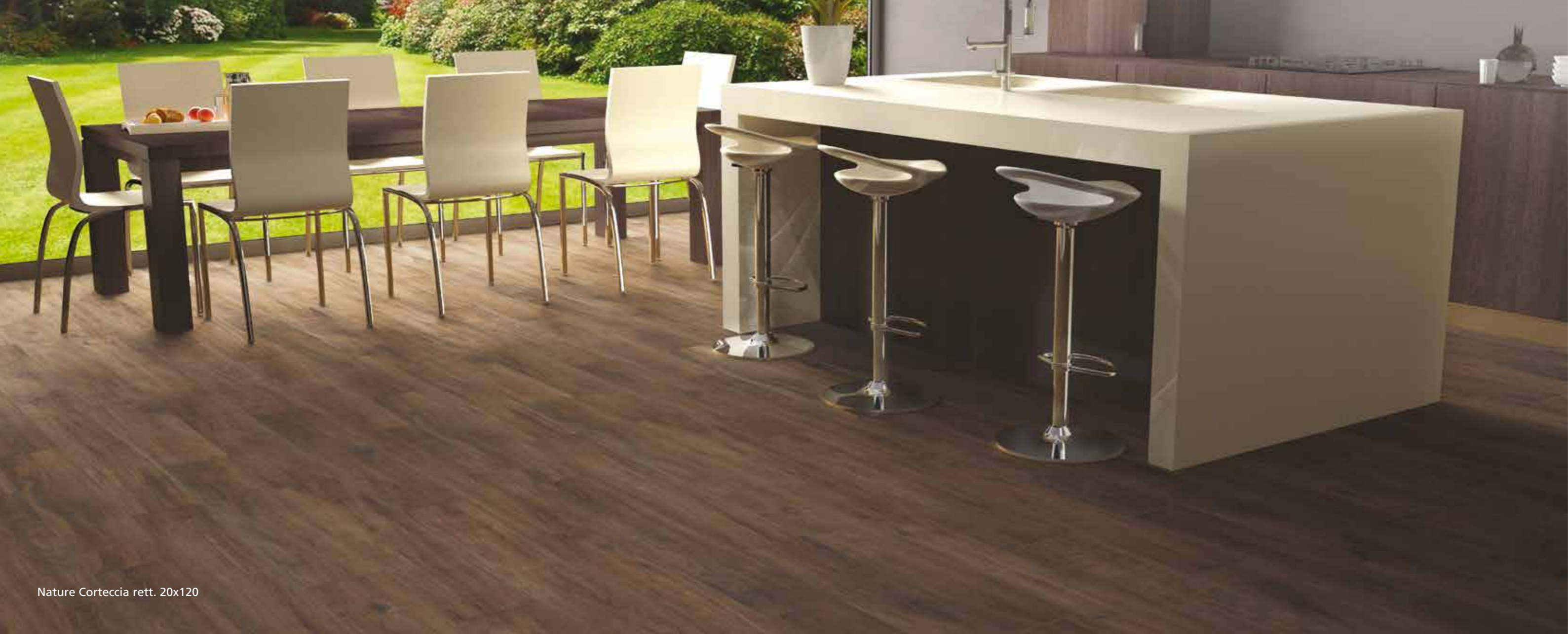
Nature Corteccia rett. 20x120