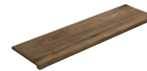
Gradone Squadrato Nature Corteccia 80 33x120x4 (Luce 29x120)