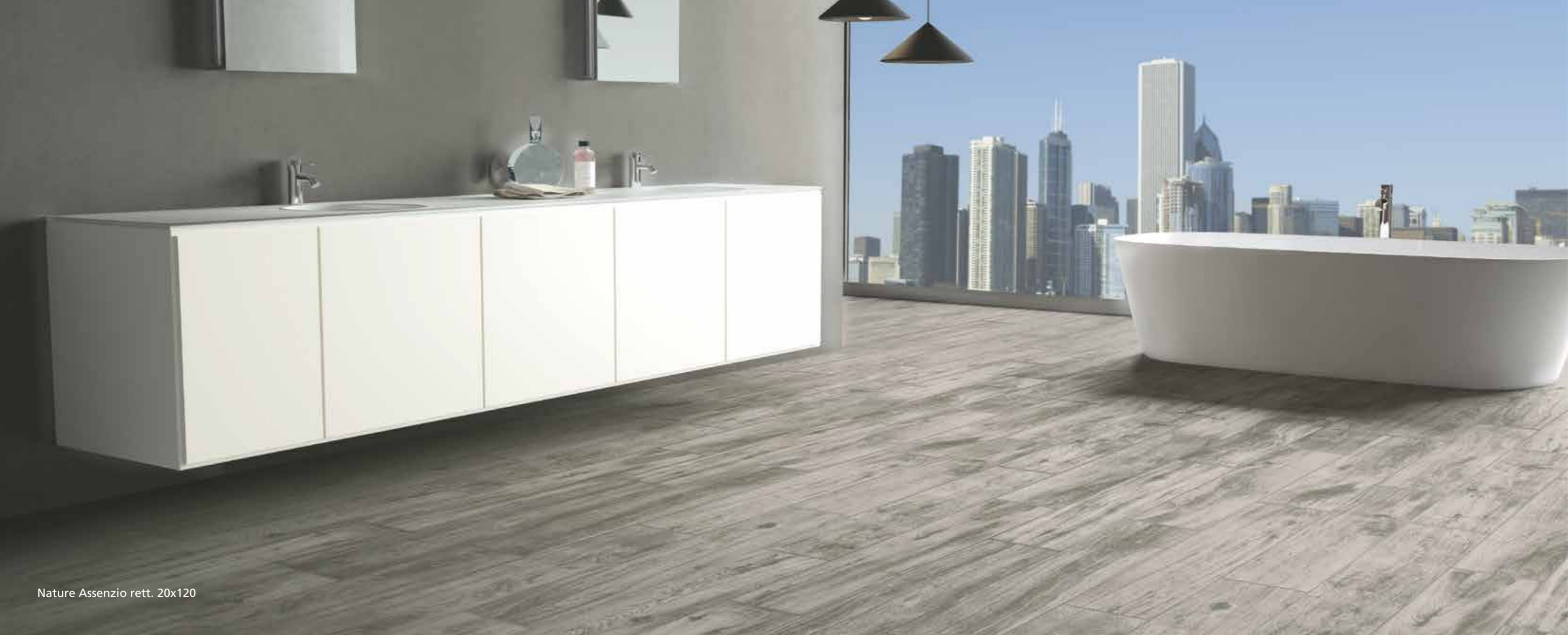
Nature Assenzio rett. 20x120