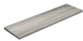
Angolare Squadrato Nature Assenzio 81 33x120x4 (Luce 29x116)