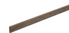
Battiscopa Nature Azou 19 8x120