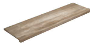
Gradone Squadrato Nature Argan 80 33x120x4 (Luce 29x120)