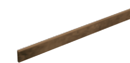
Battiscopa Nature Corteccia 19 8x120