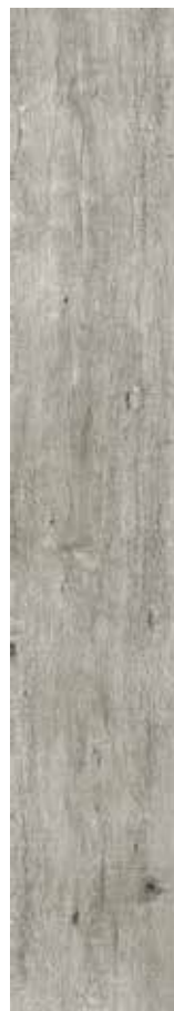
Nature Assenzio 69 rett. 20x120