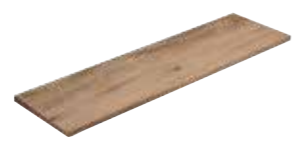
Angolare Squadrato Nature Miele 81 33x120x4 (Luce 29x116)