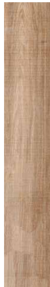
Nature Miele 69 rett. 20x120