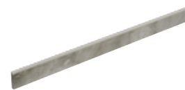
Battiscopa Nature Assenzio 19 8x120