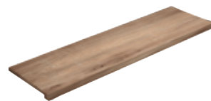
Gradone Squadrato Nature Miele 80 33x120x4 (Luce 29x120)