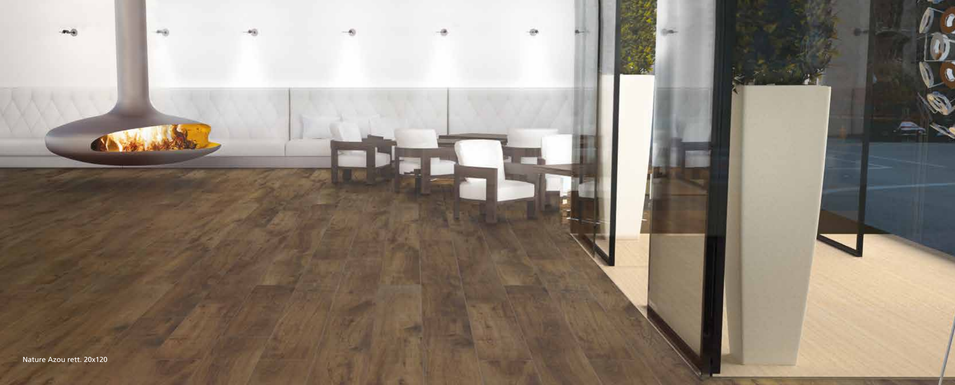
Nature Azou rett. 20x120