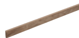
Battiscopa Nature Miele 19 8x120