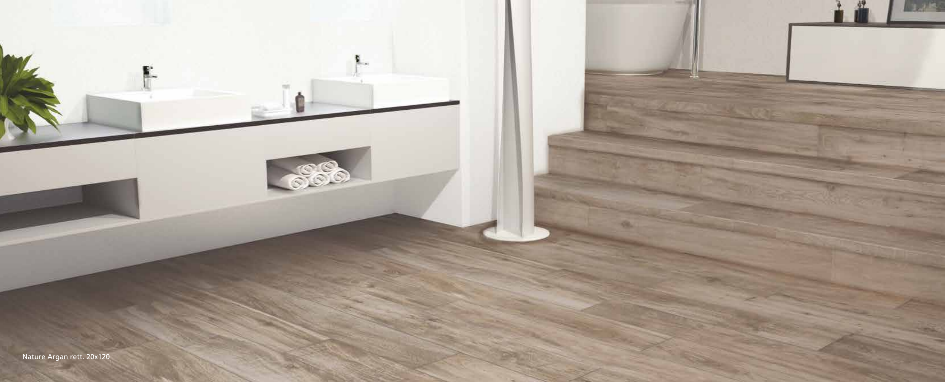
Nature Argan rett. 20x120