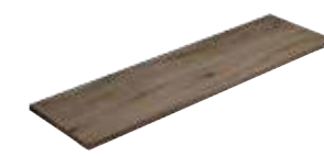
Angolare Squadrato Nature Azou 81 33x120x4 (Luce 29x116)