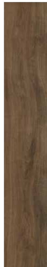
Nature Corteccia 69 rett. 20x120