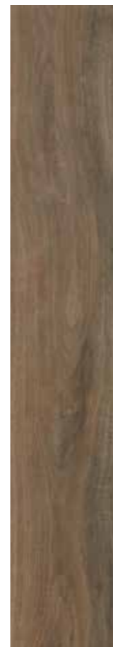
Nature Azou 69 rett. 20x120