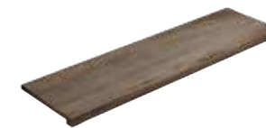
Gradone Squadrato Nature Azou 80 33x120x4 (Luce 29x120)