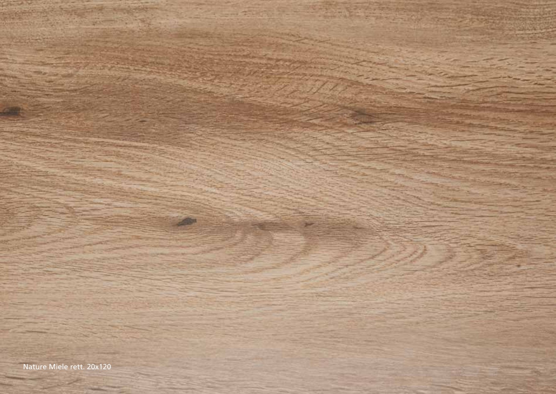
Nature Miele rett. 20x120