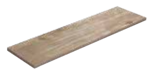
Angolare Squadrato Nature Argan 81 33x120x4 (Luce 29x116)