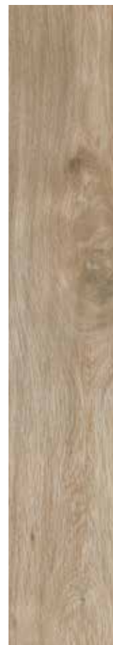
Nature Argan 69 rett. 20x120