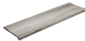
Gradone Squadrato Nature Assenzio 80 33x120x4 (Luce 29x120)