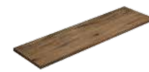
Angolare Squadrato Nature Corteccia 81 33x120x4 (Luce 29x116)