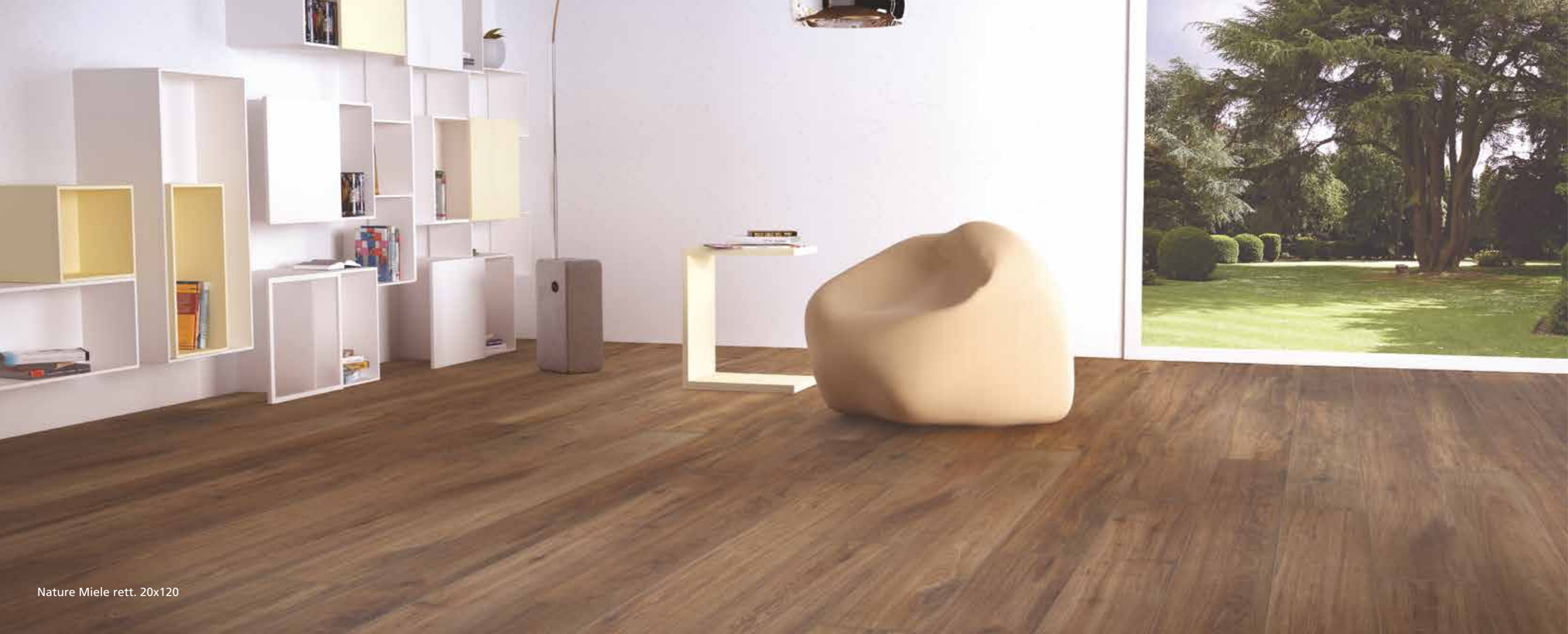
Nature Miele rett. 20x120