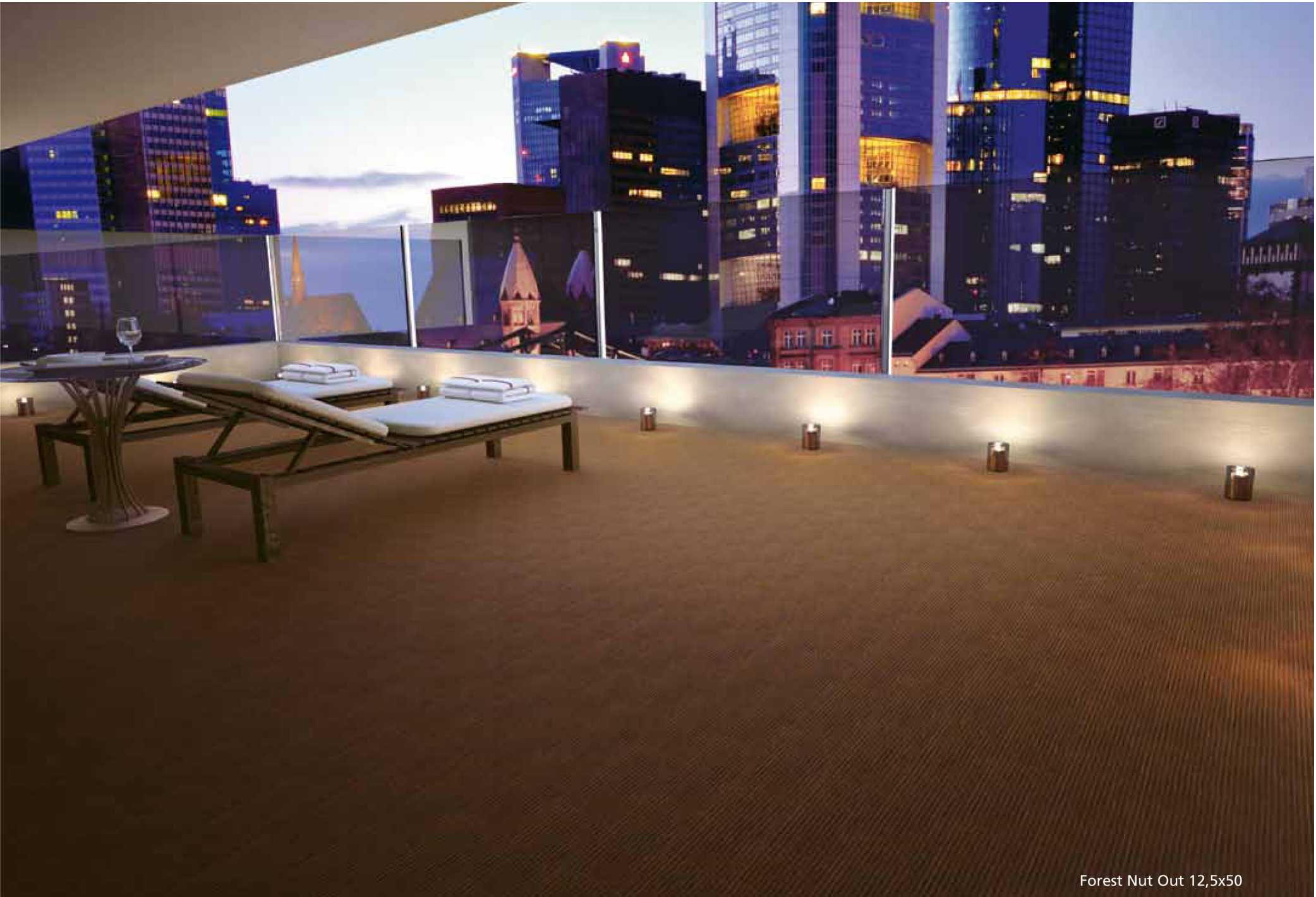
Forest Nut Out 12,5x50