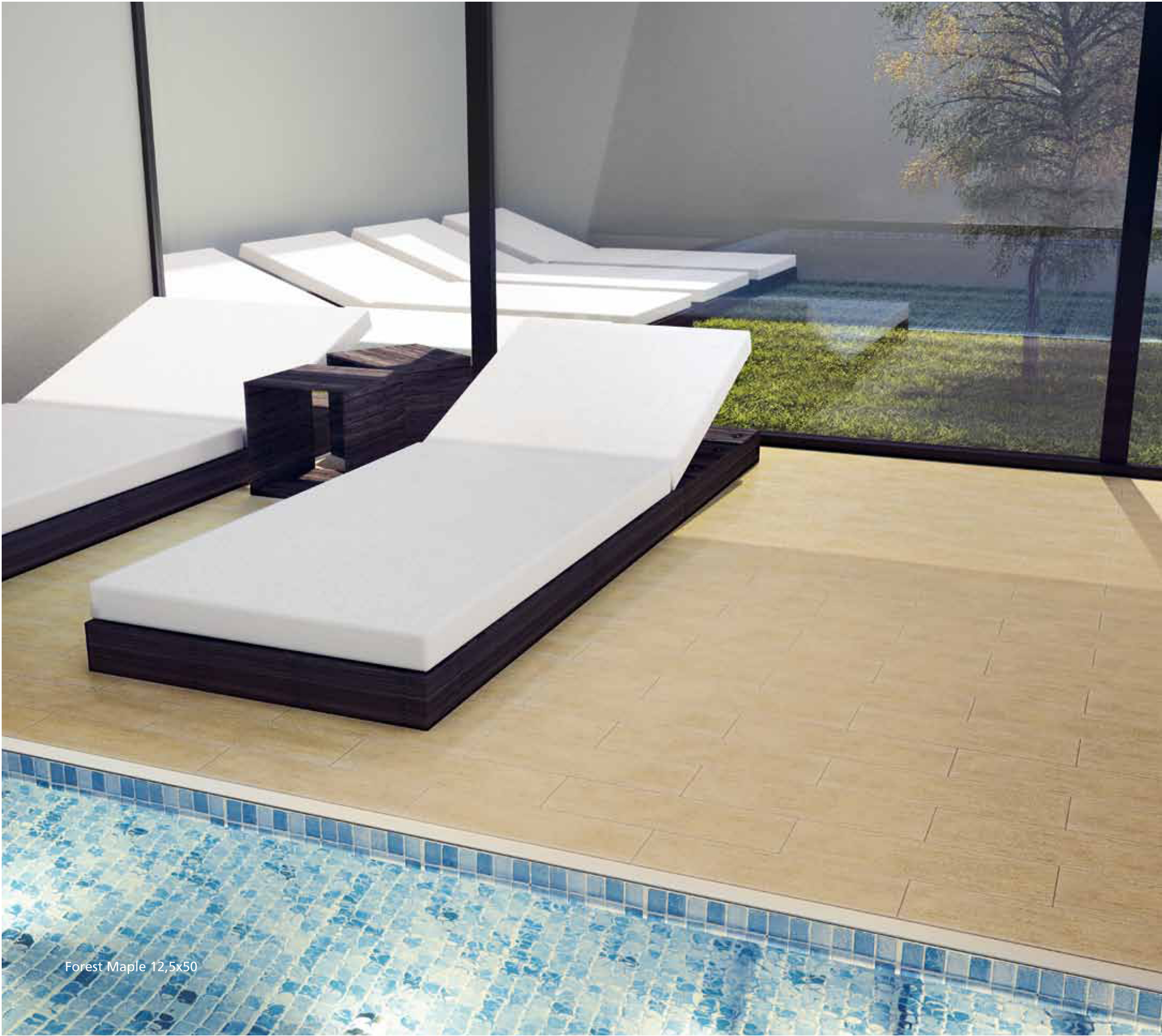
Forest Maple 12,5x50