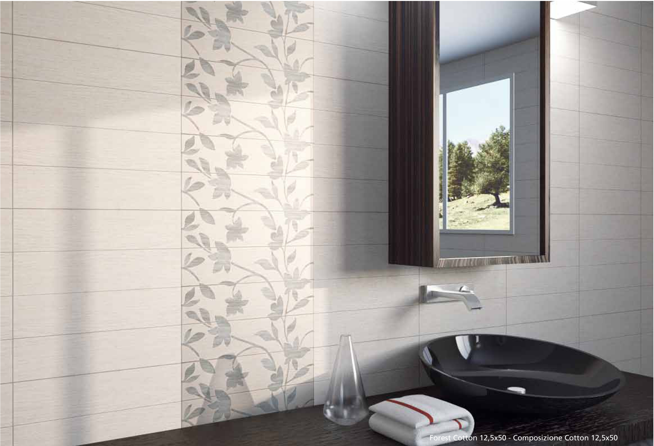
Forest Cotton 12,5x50 - Composizione Cotton 12,5x50