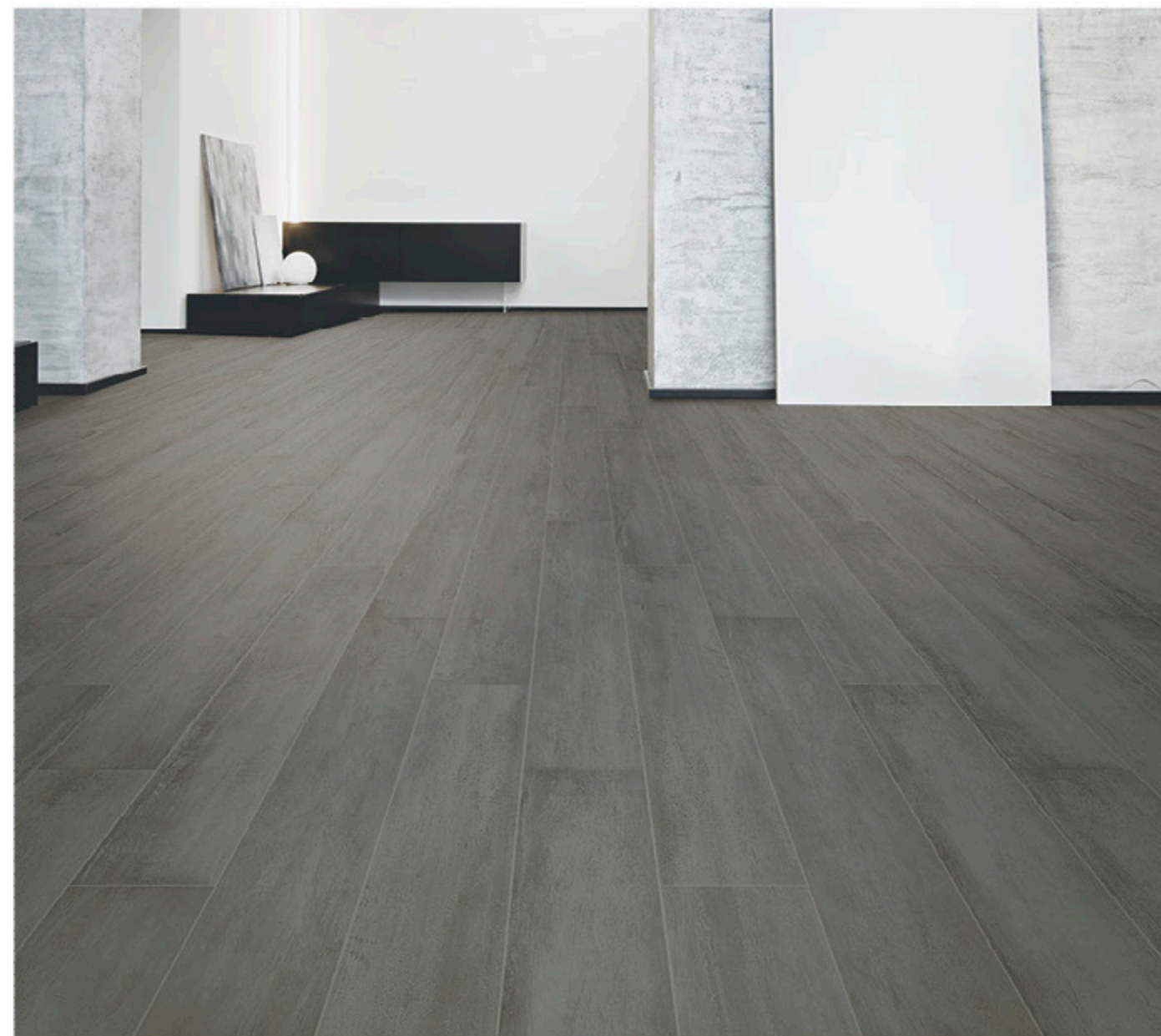
Glow 20x120 Antracite