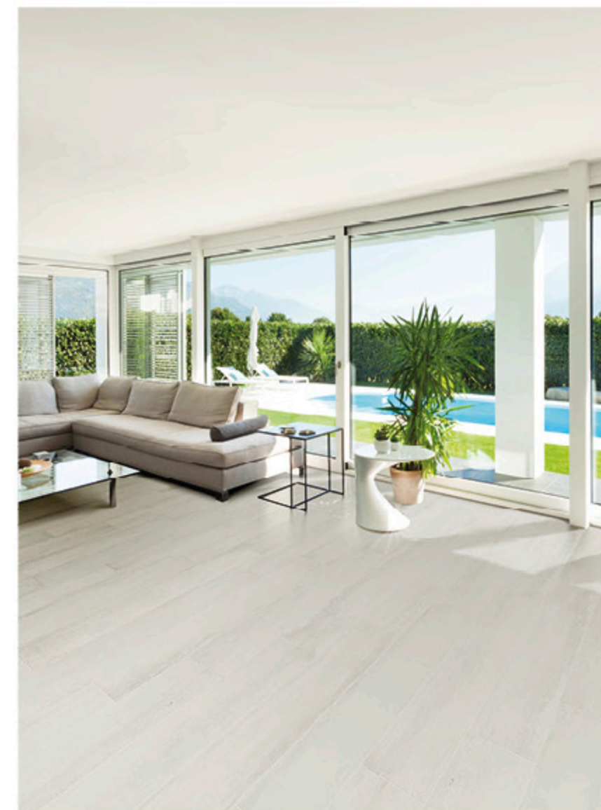
Glow 20x120 Bianco