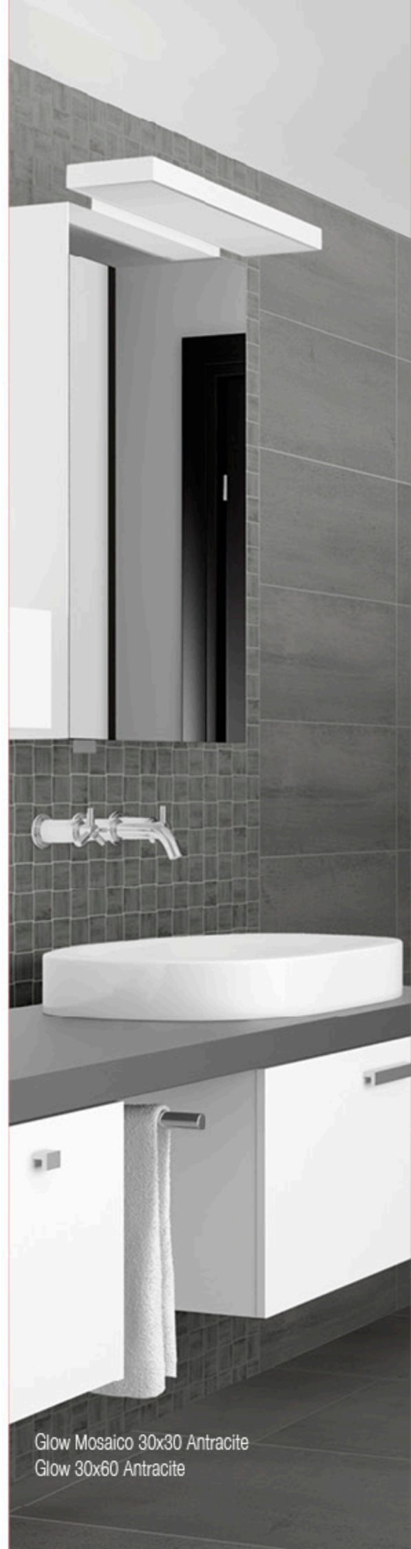
Glow Mosaico 30x30 Antracite Glow 30x60 Antracite