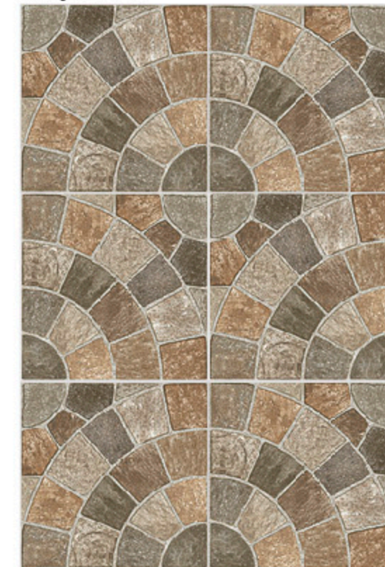
Frammenti di quarzite - Coda Pavone: Porfido